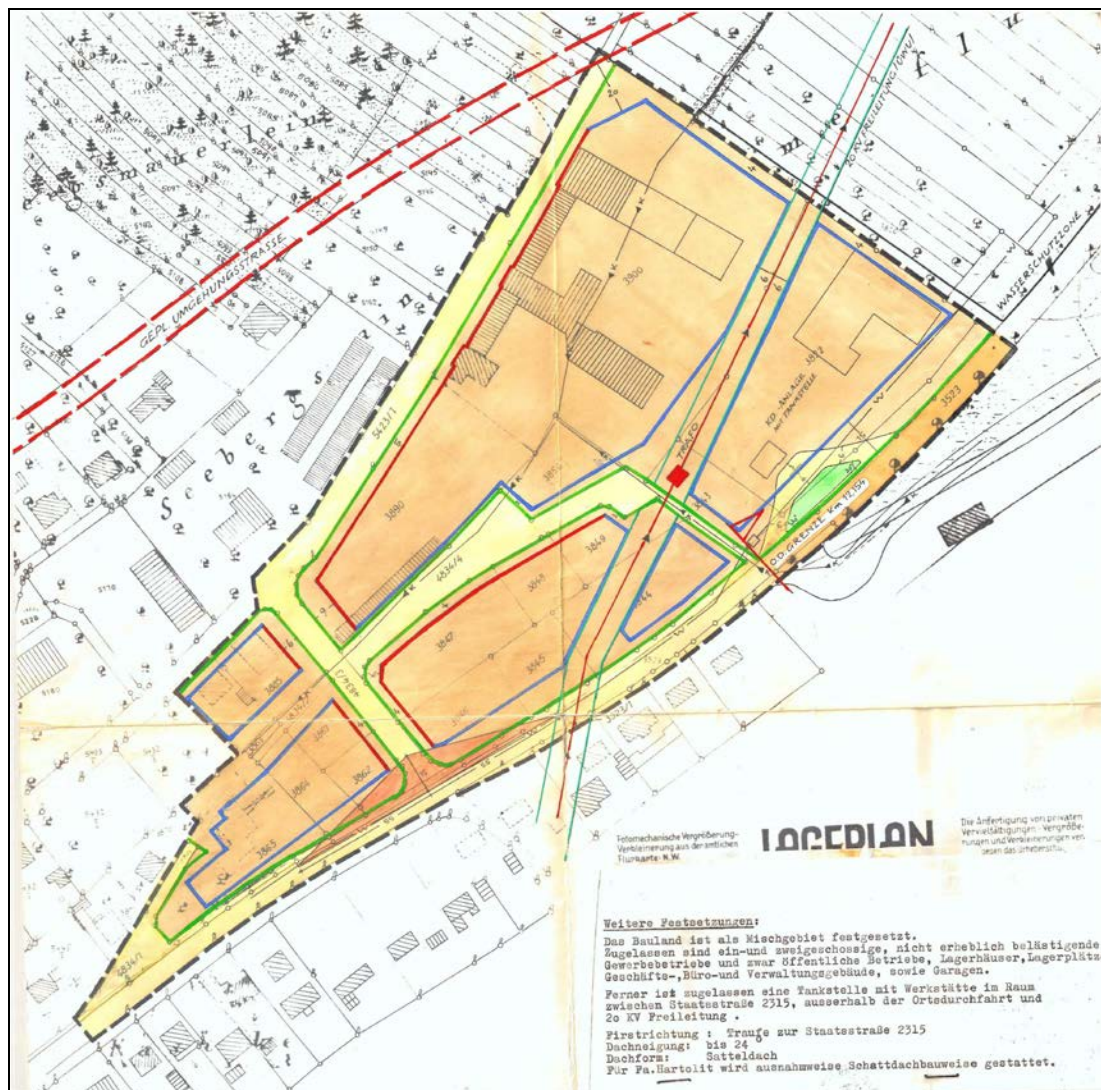
Abb. 2 Ausschnitt aus dem rechtskräftigen Bebauungsplan (ohne Maßstab)